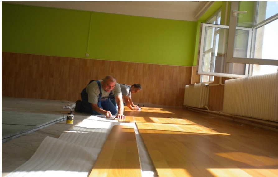
A felújítási munkafolyamat megörökítése