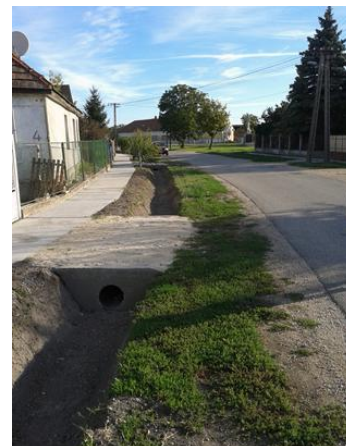
Sallai I. utca