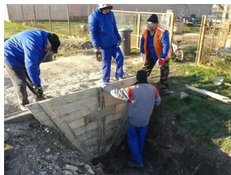
Új árokrendszer épült