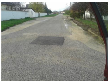
Aszfaltjavítás a Kert-közben

Önkormányzatunk 2011-ben megkezdte a település 13 km hosszú belterületi úthálózatának ütemezett felújítását (kátyúzás, padkázás, murvázás, aszfaltozás, csatornafedelek helyreállítása). A program keretében 2013-ban, a Várpalotai Közüzem Vállalat szakembereinek bevonásával megszüntettük az önkormányzati utak legsúlyosabb aszfalthibáit (kátyúk, letöredézek, árkos süllyedések). A külterületi árkok, hidak, átereszek kitisztításával megkezdtük a szőlőhegyi és a gazdasági bekötőutak rendbetételét. A tél beköszöntése előtt, még november hónapban elvégeztük az útpadkák javítását.