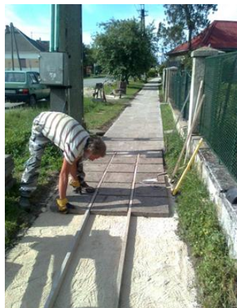
Kossuth L. utca

A gyalogos közlekedés biztonságát – különösen téli időszakban – veszélyessé teszi a járda lepusztult állapota. A balesetek lehetőségét tovább növeli, hogy a keskeny és rossz állapotú járdák miatt a gyalogos forgalom részben az úttestre kényszerül (pl. babakocsi, mozgássérült jármű, stb.). Önkormányzatunk ezért 2011-től átfogó járda-felújítási programba kezdett. Ennek keretében 2013-ban a Kossuth Lajos utca páratlan oldalán, a Sallai Imre utca páros oldalán, valamint a József Attila utca és a Dózsa György utca egy-egy szakaszán tettük biztonságossá és esztétikussá a több évtizede elhanyagolt állapotú gyalogjárdát.