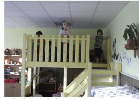
Galéria az új óvodai csoportban

A fűtési szezon kezdetén, az óvoda és az általános iskola fűtését biztosító egyik gázkazán is meghibásodott, melyet szintén cserélni kellett. (A beszerelt 80KW-os gázkazán költsége az Önkormányzat és a KLIK között létrejött megállapodás alapján 30:70 arányban oszlott meg.)