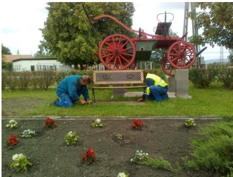
Virágosítás a Kossuth parkban