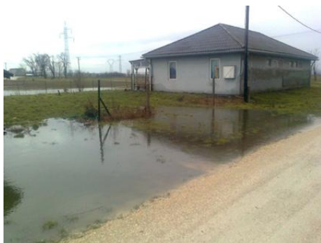
Belvíz a Szigetben

2013 tavaszán már csak a Szigetpuszta településrész középső, lefolyástalan területén alakult ki koratavasszal belvíz miatti krízishelyzet. Az évről-évre visszaköszönő probléma megoldása érdekében geodéziai méréseket végeztünk, és vízügyi szakember bevonásával részletes tervet készítettünk. A lakossági tájékoztatót követően december hónapban elvégeztük a szükséges munkálatokat (árok mélyítés, hidak, átereszek megfelelő szintre történő áthelyezése, út-átvágás, földmunkák, hídfejek-kialakítás, stb.).